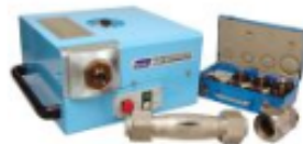
EZY MAT 2 pre-Swaging & Flaring Machine