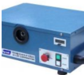
EZY MAT 5 Auto Swaging Machine