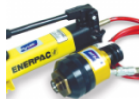
EZY-MAT I Pre-Assembly Machine

Das hydraulische Vormontagesystem der Hy-Lok Corporation ist ausgelegt für die Verwendung mit allen Hy-Lok Klemmringverschraubungen der Größen 1/2" bis 2" (12mm bis 38mm).